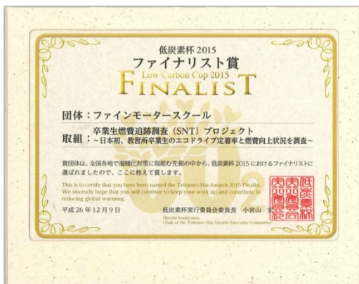
審査通過の証として授与された「ファイナリスト賞」

SNTプロジェクトでは、運転免許取得時にエコドライブを身に付けることの効果の検証として、卒業生が免許取得後に、どの程度エコドライブを継続して実践できているか、教習所卒業後6ヶ月から2年を経て、在校時と比べてどのように燃費が変化しているかを追跡調査しています。その後は、前述の対象者と免許取得後にエコドライブを身につけた人とを比較し、エコドライブの技術や知識の定着率がどのように変化するかを調査しています。