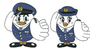
埼玉県警察マスコット「ポツポくん」「ポポ美ちゃん」