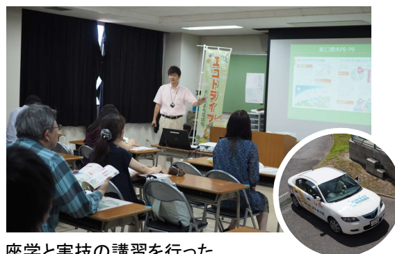
座学と実技の講習を行った

ファインモーターズスクールは、『くるまと地球環境の共存』の実現をめざし、自治体や地域と協力し、イベントへの出展、エコドライブの普及活動を続けてまいります。